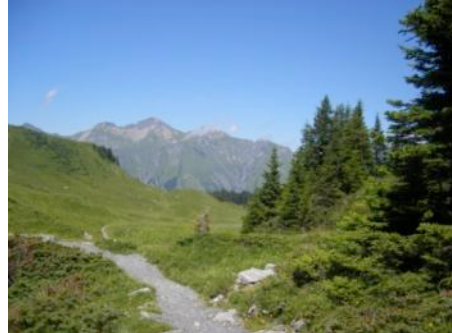
Catrina Wäfler Fachfrau Gesundheit-E in Ausbildung

Ich präge mir immer wieder neue Eindrücke und Bilder ein, die mir in guter und schöner Erinnerung bleiben.