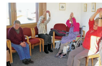
Die Donnschtig-Gruppe turnt